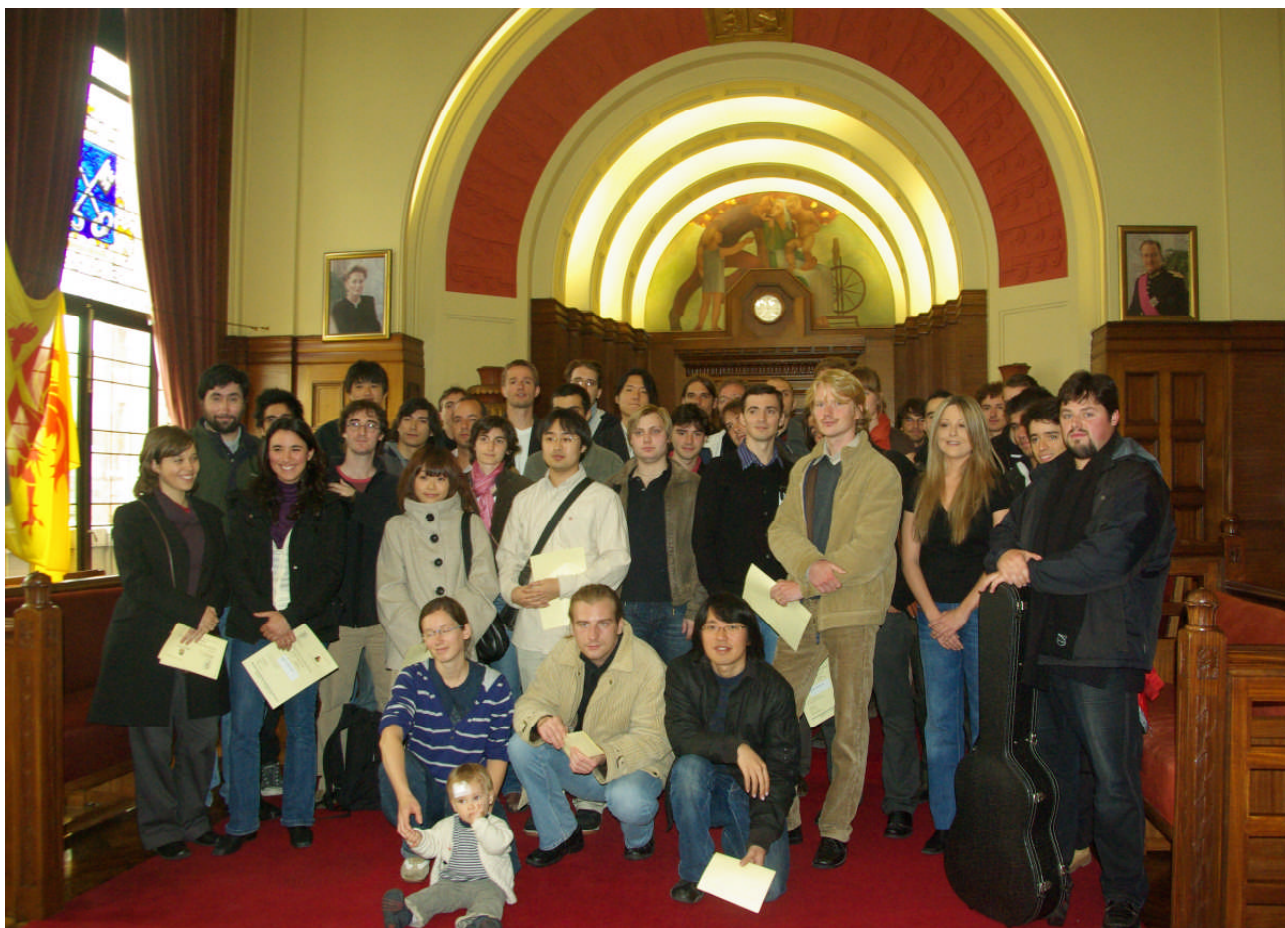
Les concurrents de l'édition 2008 après la séance de tirage au sort de leur ordre de passage le 25 septembre 2008 à l'hôtel de Ville de Charleroi